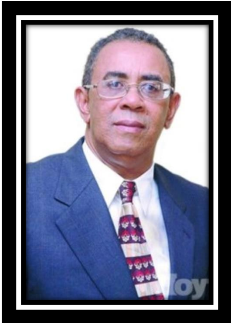
Diógenes Céspedes Escritor-Crítico de Arte