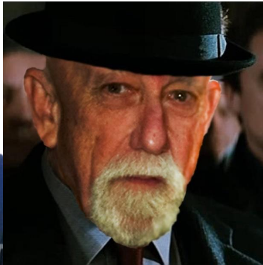
Diógenes Céspedes Escritor-Crítico de Arte